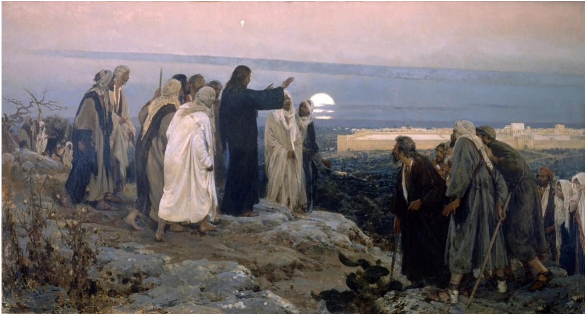
“Jesús afirma su rostro para ir a Jerusalén.” Lucas 9:51

Al entrar en Jerusalén como un Rey, sobre los lomos de un pollino, Jesús seguramente debió haber tenido emociones encontradas cuando la acogedora multitud le adoraba como el Mesías, agitando las palmas y gritando: “¡Hosanna! ¡Bendito el que viene en el nombre del Señor!” (Marcos 11:9). En sólo cinco días se cumplirían las palabras del profeta Isaías: “A los que me herían les ofrecí la espalda, y a los que me arrancaban la barba les ofrecí la mejilla; no escondí mi rostro de las injurias ni de los escupitajos.” Isaías 50: 5-6 RVC